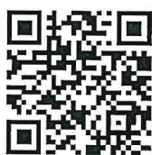
ผังน้ำ ลุ่มน้ำภาคใต้ ฝั่งตะวันออกตอนบน